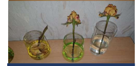
Abb. 5 Antibakterielles Gesichtswasser