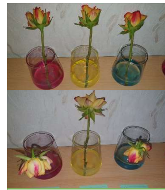
Abb. 7 Zitronensaft