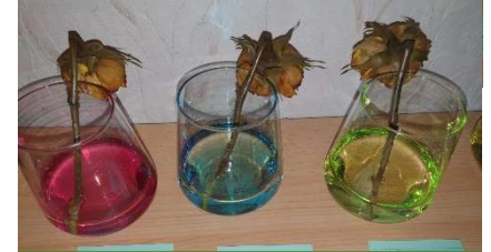
Abb. 6 Aspirin