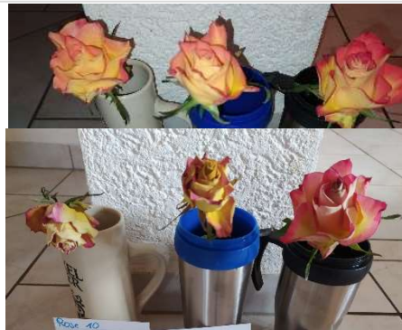
Abb. 4 Mittel aus dem Blumenladen