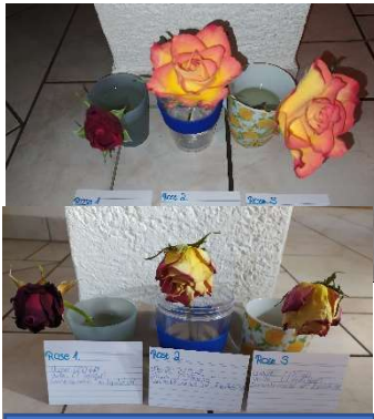
Abb. 1 Wasser