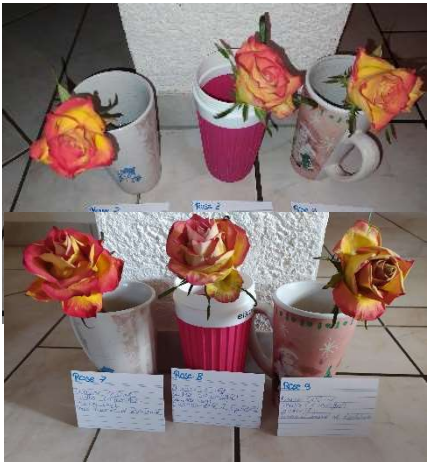
Abb. 3 Zucker