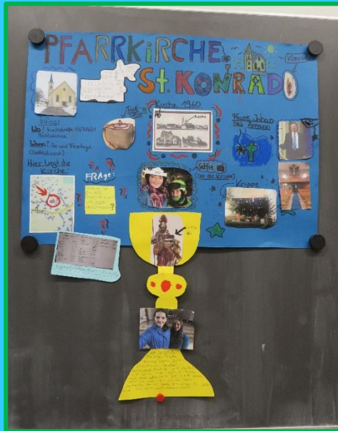
Vorstellung meiner Kirchengemeinde